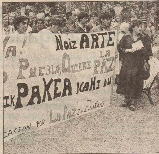
Vista de una concentración por la paz en San Sebastián./MICHELENA

El 25% cree que se debería intentar la reinserción de los presos que no hayan cometido delitos de sangre